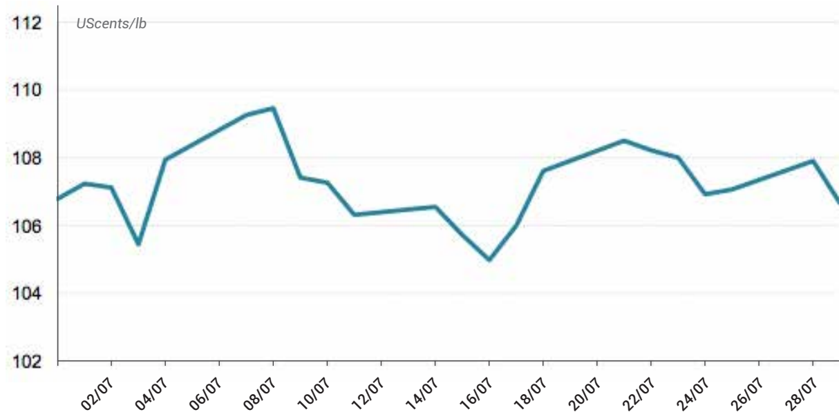
Biểu đồ 1: Diễn biến giá tổng hợp của cà phê thế giới trong tháng 7/ 2018

giảm, nhưng vẫn ở mức cao. Theo Hiệp hội Cà phê Hạt của Hoa Kỳ, tồn kho dự trữ tại các kho cảng của nước này đã giảm 23.366 bao (tương đương 0,3%) so với cuối tháng 5, xuống còn 6.844.229 bao trong tháng 6.