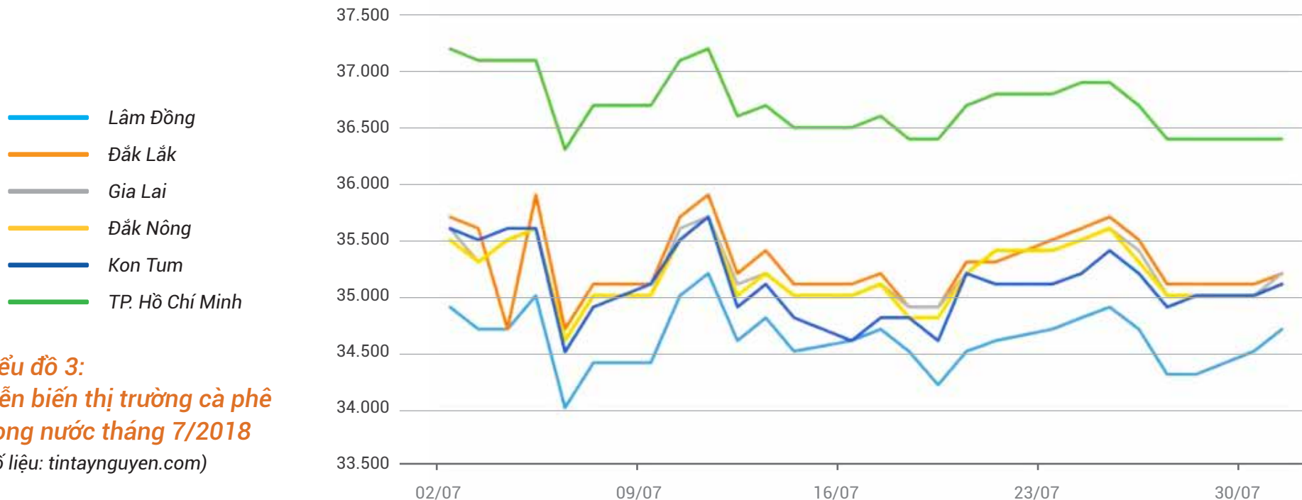
Biểu đồ 3: Diễn biến thị trường cà phê trong nước tháng 7/2018 (Số liệu: tintaynguyen.com)

Tại các kho quanh khu vực Thành phố Hồ Chí Minh, giá cà phê Robusta loại R1 giảm 2,2%, xuống còn 36.400 đồng/kg.